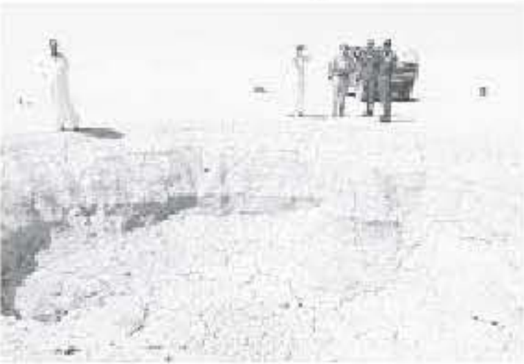
الانباط - معان

مشابهة راجيا من الجميع الإبلاغ الفوري عن ذلك حفاظاً على سلامة الجميع وخاصة بالصحور. وقال النواصرة في منطقة قاع الجفر المحاذي لمنطقة الدبدابيه جنوب شرق الجفر بعد ان ابلغهم بوجودها احد المواطنين. وقال النواصرة، انه وعلى الفور قامت كوادر بلدية الجفر بتوجه للموقع برهقة تشرطة بلدية الجفر وبعد معاينة الموقع تحركت لورد البلدية لعمل سائر تراسي يحمي الاهالي من الوقوع بهند الحفرة العميقة. وطالب النواصرة من المواطنين أخذ الحيطة والحذر من وجود الهياكل أخرى