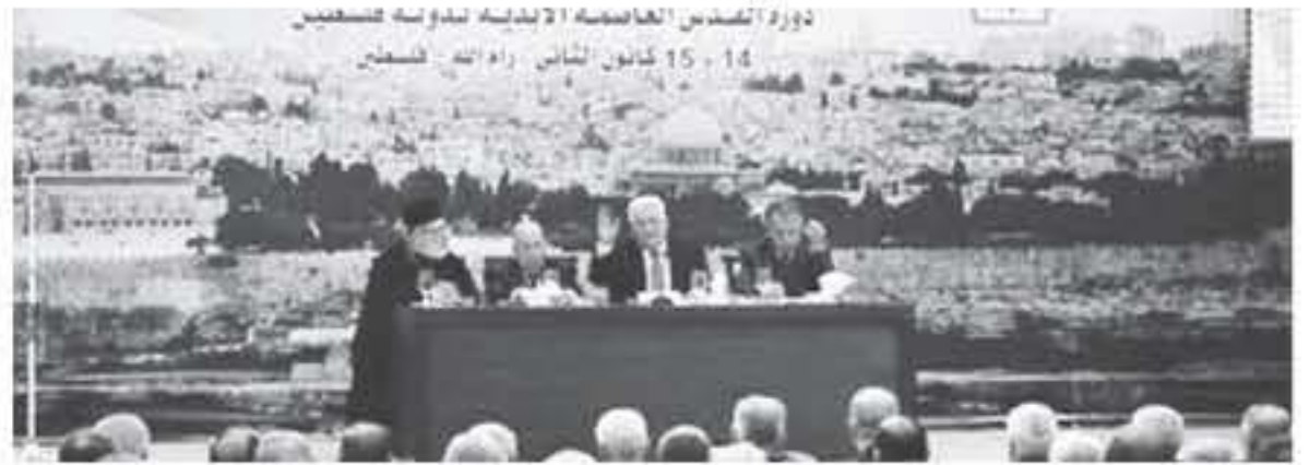
دورة المجلس المركزي الفلسطينية الـ 14، 15 كانون الثاني 2018