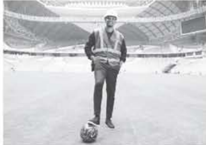
الدوحة - خاص

العالم لكرة القدم، ما يسجل البطولة حدثاً استثنائياً بالنسبة للأفارقة الذين لم نتج لهم من قبل فرصة حضور المونديال في قطر، سيبدأ أمام المنتخب لأول مرة في تاريخ البطولة فرصة حضور أكثر من مباراة في اليوم الواحد، دون تكبد عناء السفر من مدينة لأخرى.